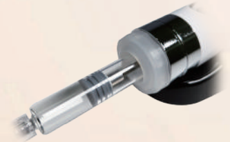
5cc용 주사기 고정캡