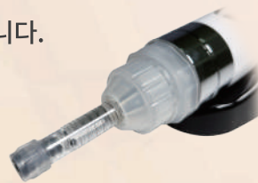
1~3cc용 주사기 고정캡